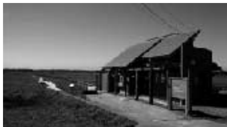
霧多布湿原トラストインフォメーションセンター