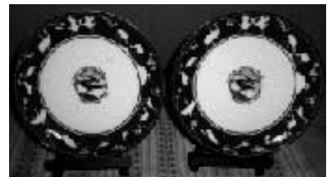
NPO法人認証10年記念プレート： 枚1500円