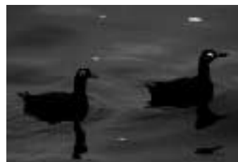
ケイマフリの夫婦

じつは、ケイマフリは世界的には珍しい種で極東にしか生息していない。北海道では五百羽ぐらいと危険な状態で、霧多布の小島でも一時5羽までに減ってしまった。それが今年には19羽集まり3つがい繁殖と回復の兆しがでてきた。その要因は、エトピリカのデコイに同じ仲間がいると集まってきた可能性が高い。目的とは違う効果だが、それはそれで何よりだと思う。